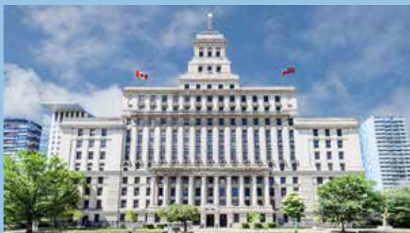
Immeuble historique : Édifice Canada Life à Toronto. Propriété de La Compagnie d'Assurance du Canada sur la Vie et géré par la Great-West Life Conseillers immobiliers.