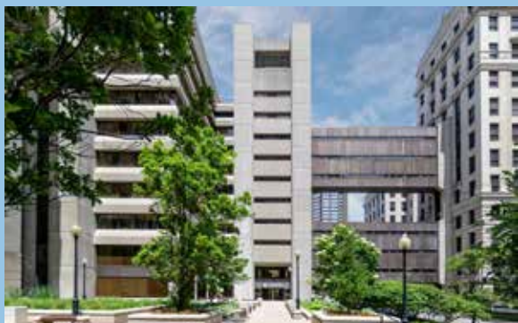
Installation d'entreprise : 190 Simcoe Street à Toronto. Propriété de La Compagnie d'Assurance du Canada sur la Vie et géré par la Great-West Life Conseillers immobiliers.