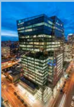
Immeuble de bureaux (250 000 à 499 999 pi 2 ) 745 Thurlow , Vancouver, C.-B., propriété de 2748355 Canada Inc. et de 745 Thurlow St Holdings Inc. et géré par QuadReal Property Group LP